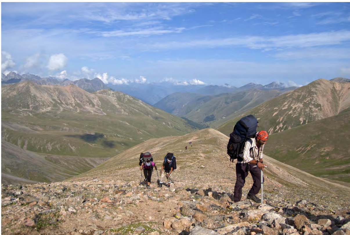
Фото 12 – Движемся на перевал Балк-баши