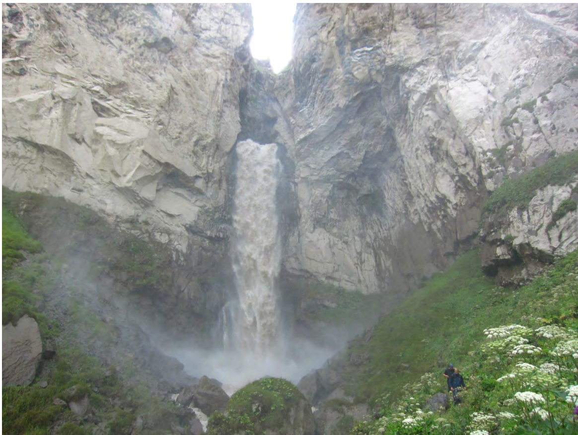
Фото 19 – Водопад Султан