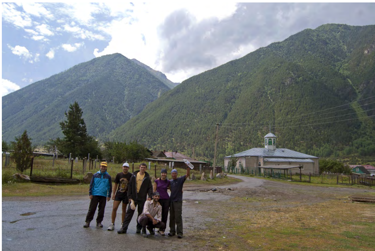
Фото 1 – Группа в поселке Хурзук