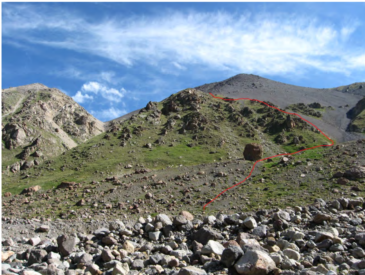
Фото 9 – Красной линией отмечен путь группы на перевал Кольцевой