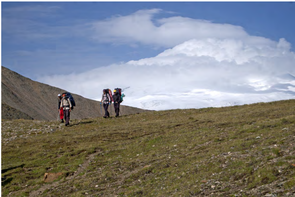
Фото 25 – Спуск с перевала Исламчат