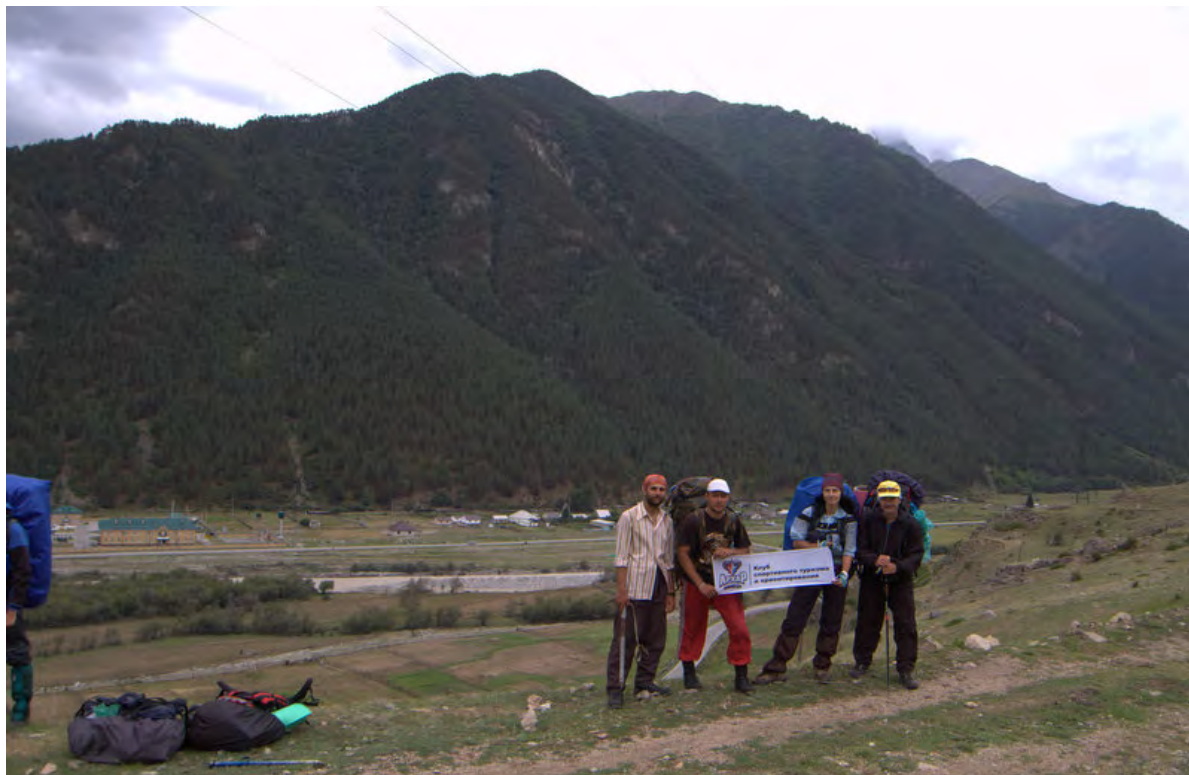
Фото 32 – В поселке Верхний Баксан