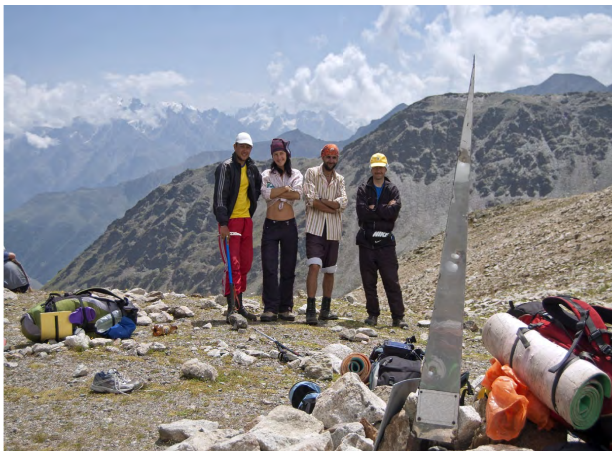
Фото 26 – Группа на перевале Кыртыкауш