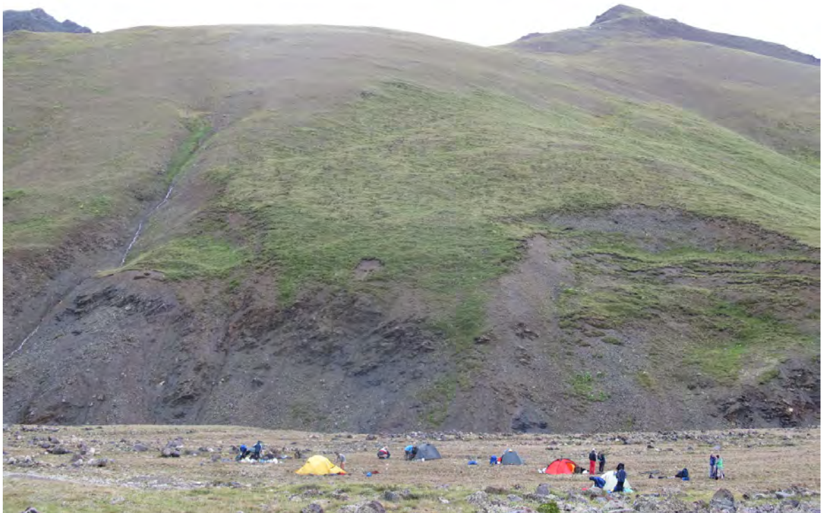
Фото 21 – Стоянка на левом берегу р. Каракаясу, перед перевалом Исламчат