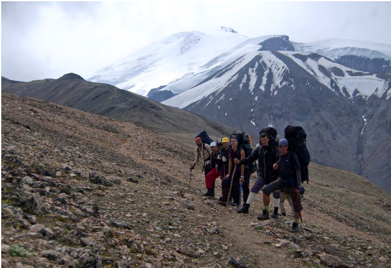
Фото 13 – Подъем на перевал Балк-баши