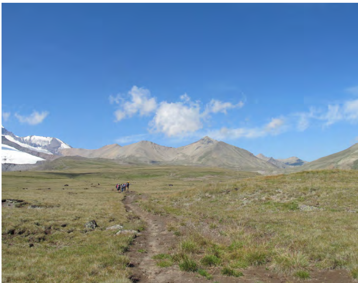
Фото 18 – Движемся по плато Ирахиксырт