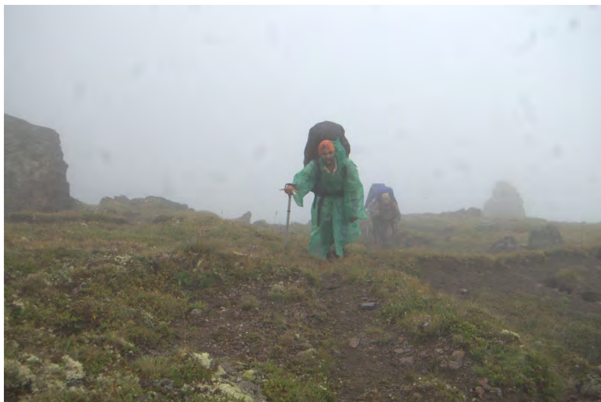
Фото 4 – Подъем на перевал Нижний Куршоу, сильный туман, видимость ограничена