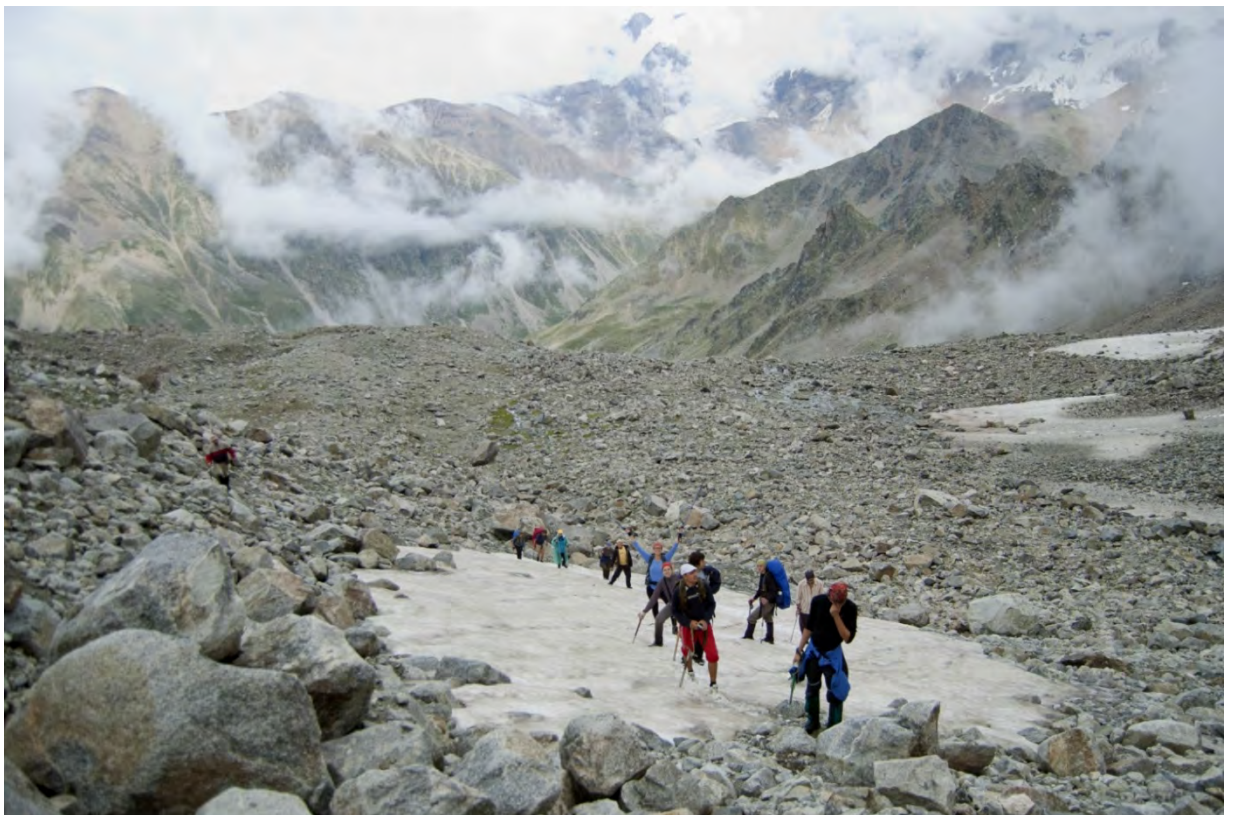
Фото 6 – Спуск с перевала Куршоу Нижний