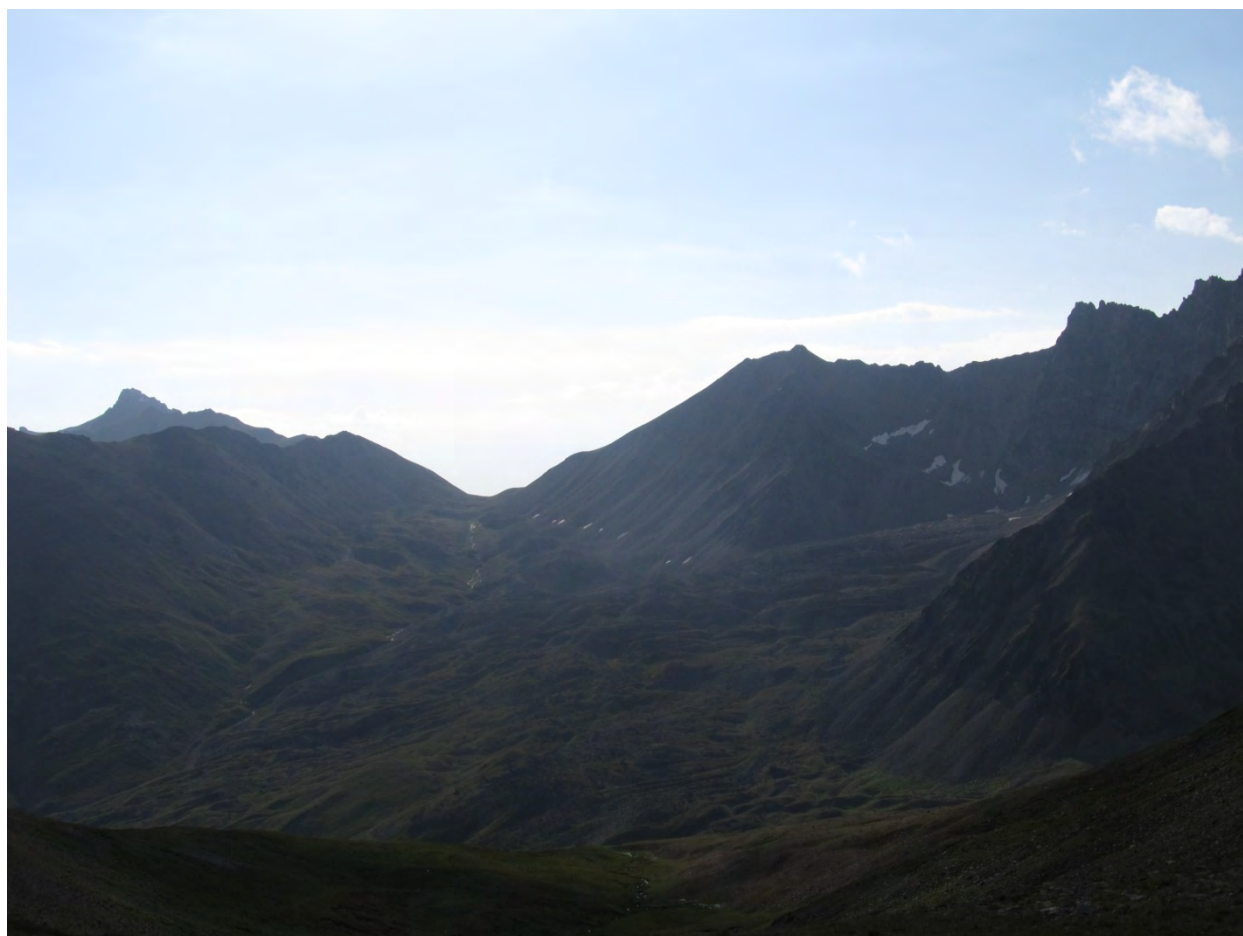
Фото 24 – Вид на перевал Кыртыкауш с перевала Исламчат