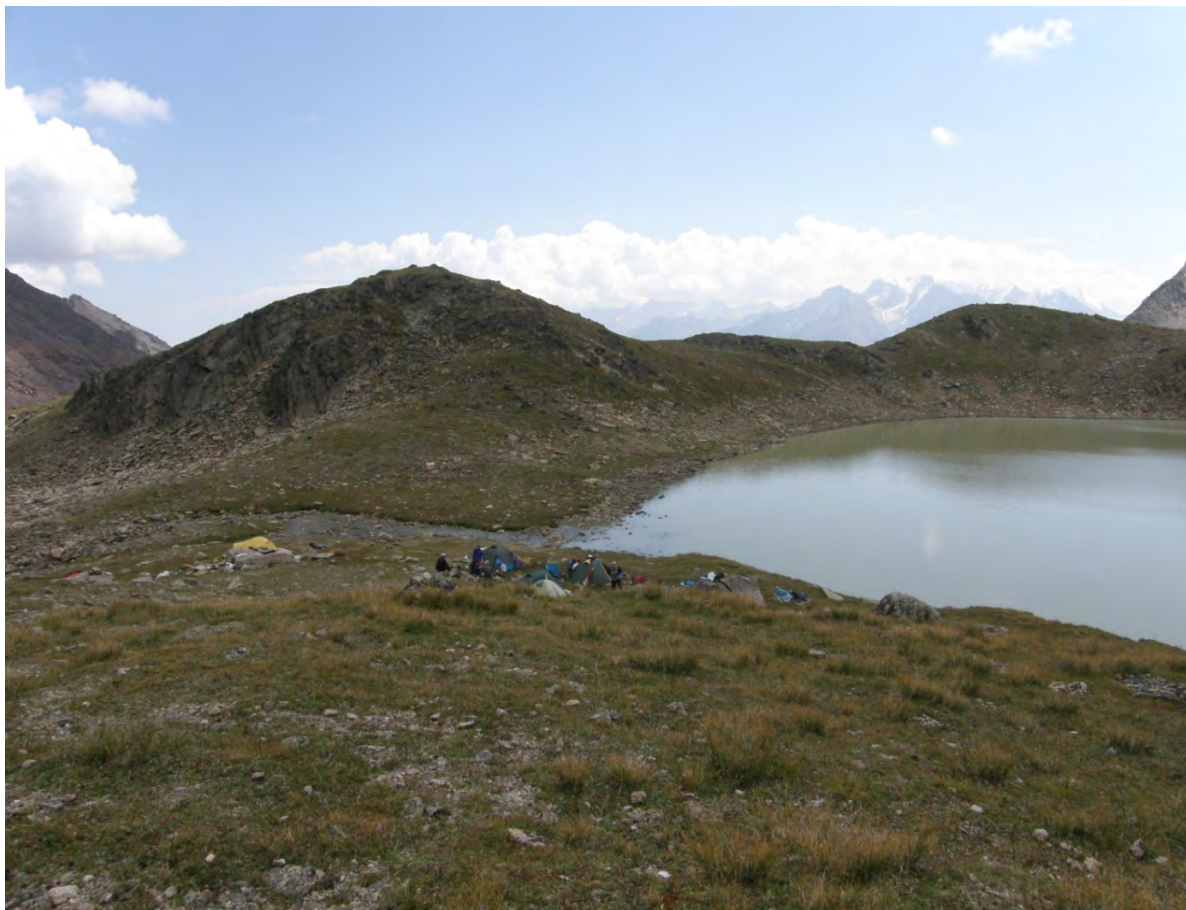
Фото 31 – Лагерь на озере Сылтранкель