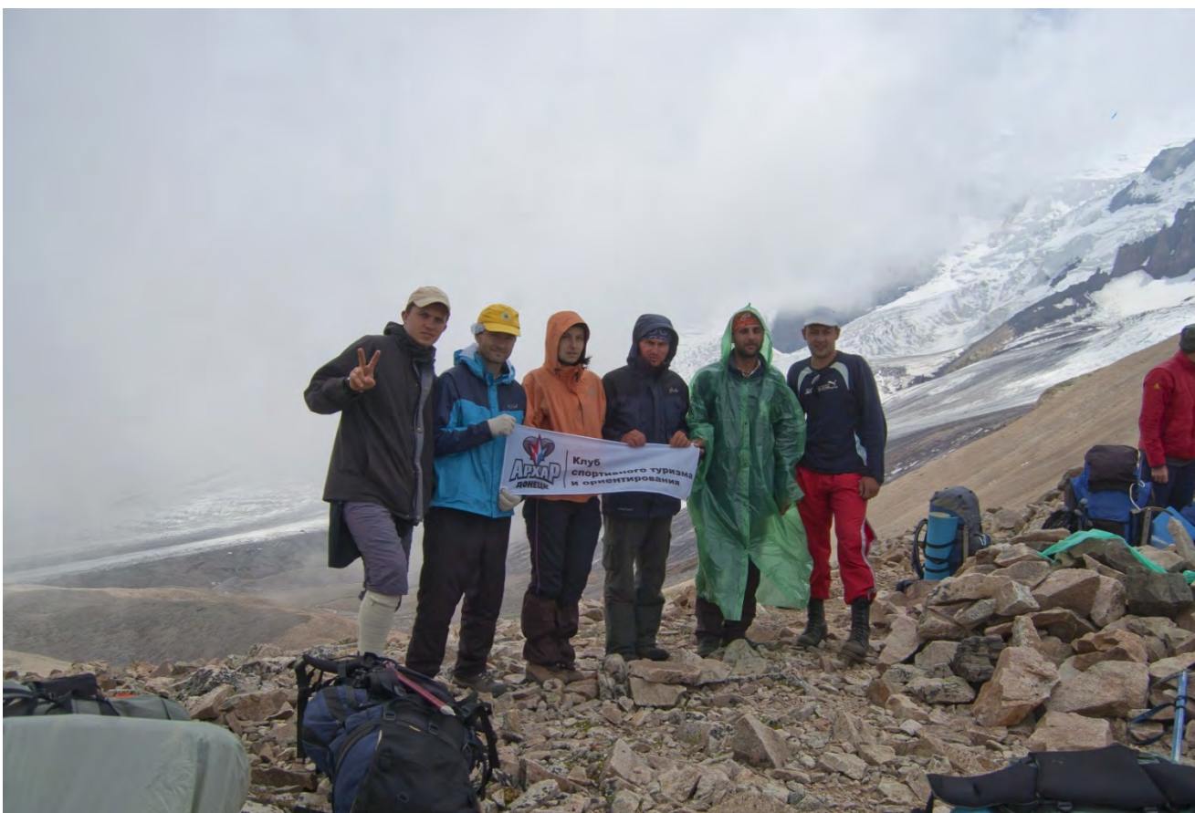
Фото 14 – На перевале Балк-баши