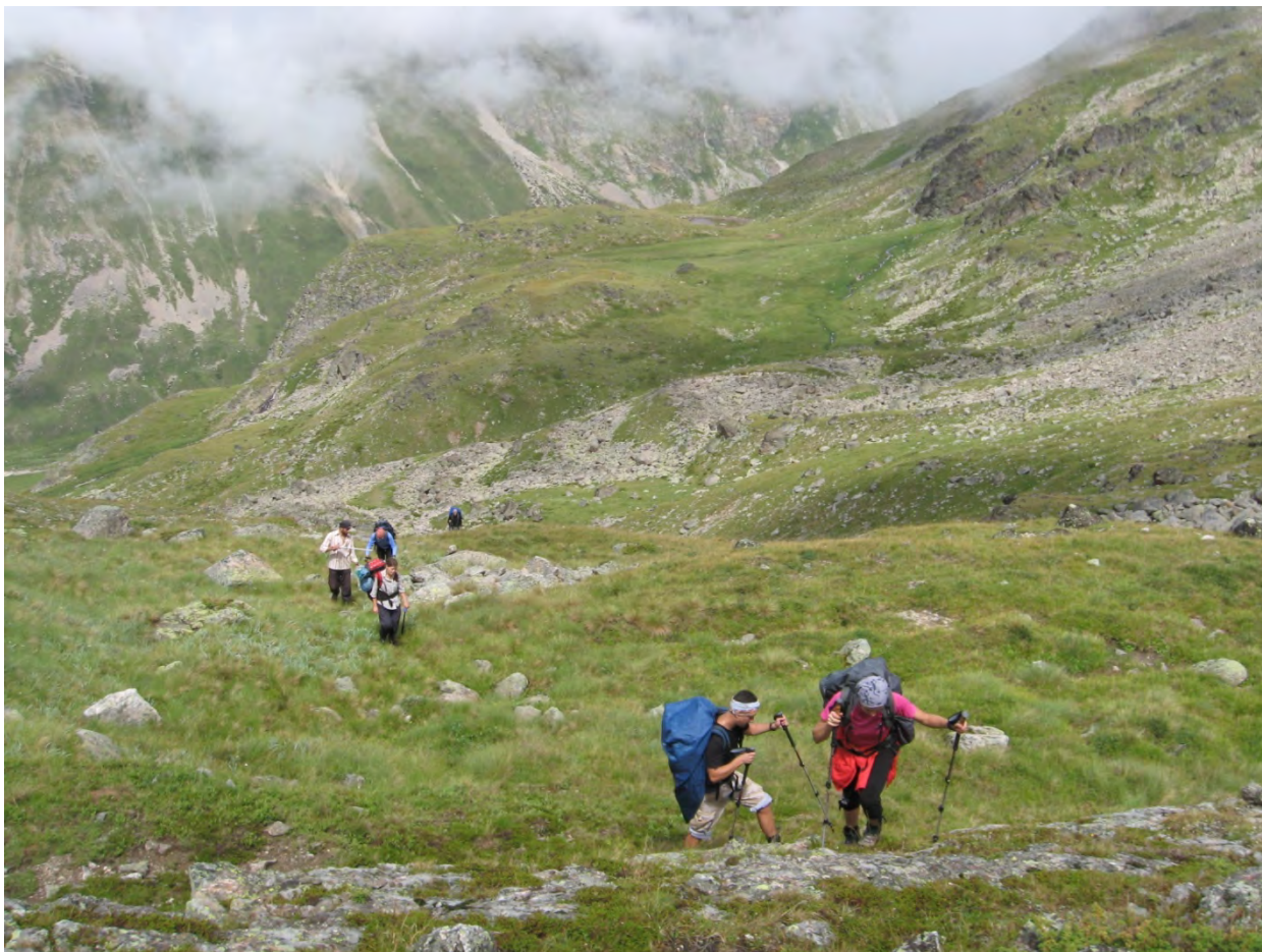
Фото 3 – Начало подъема на перевал Нижний Куршоу