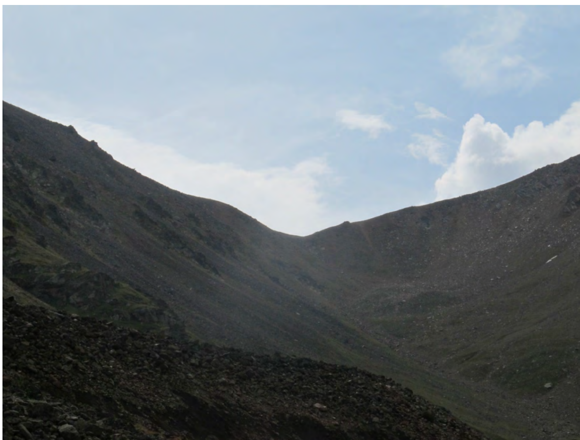
Фото 28 – Перевал Сылтран