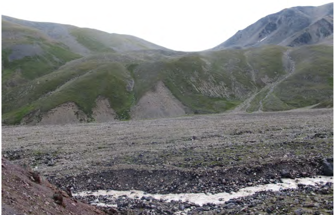
Фото 22 – Вид с левого берега р. Каракаясу на перевал Исламчат