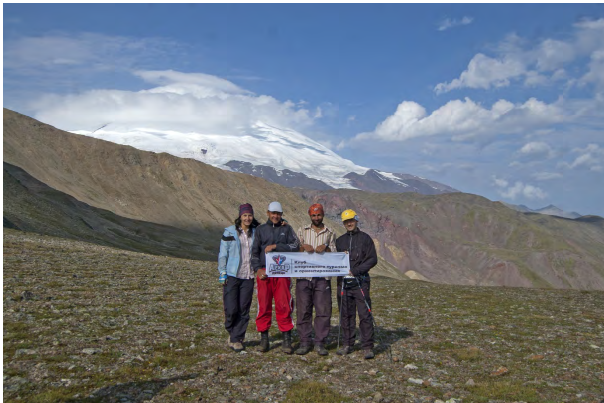
Фото 23 – Группа на перевале Исламчат