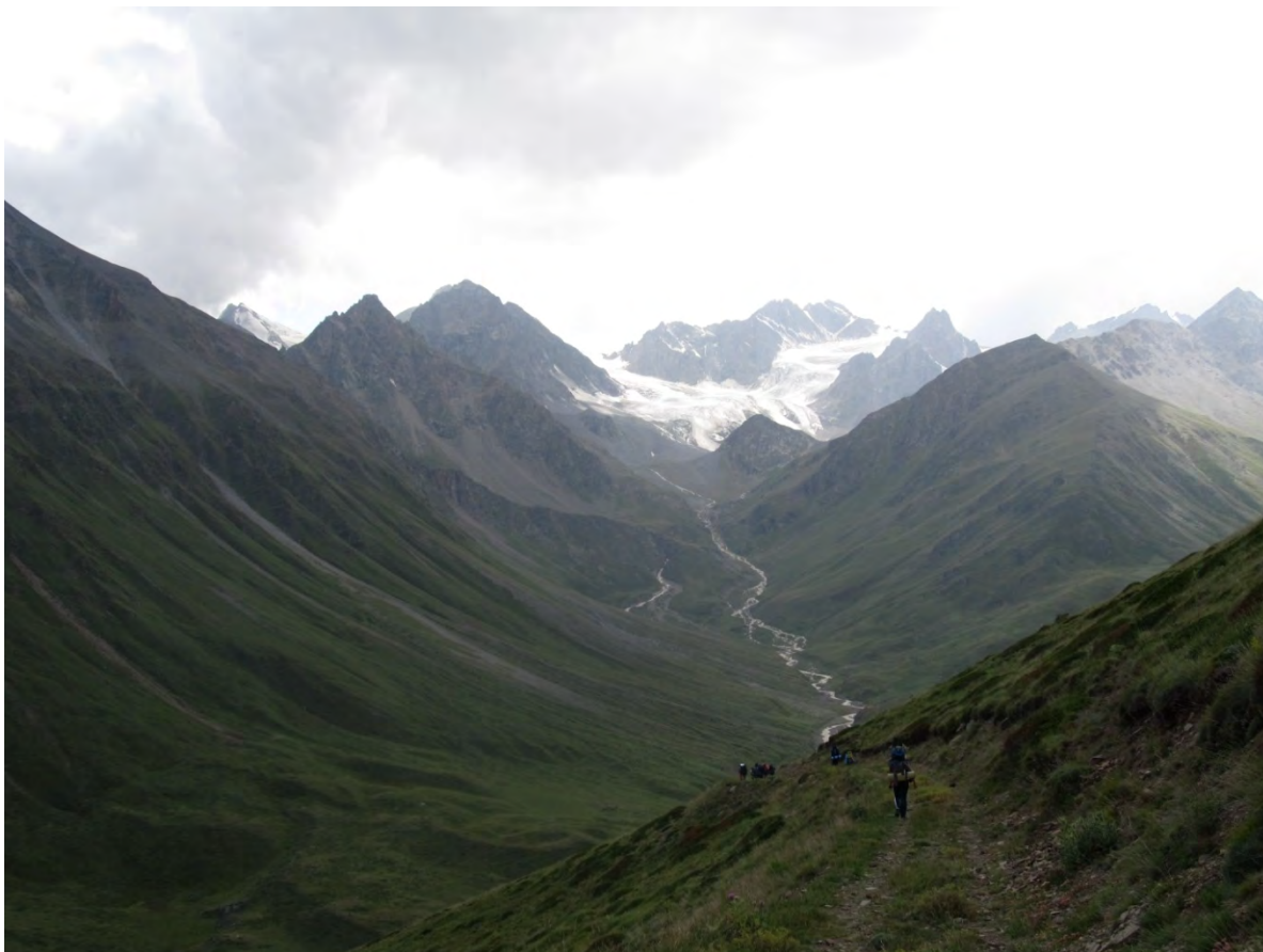
Фото 27 – Долина реки Мкяра, слева приток Мукал