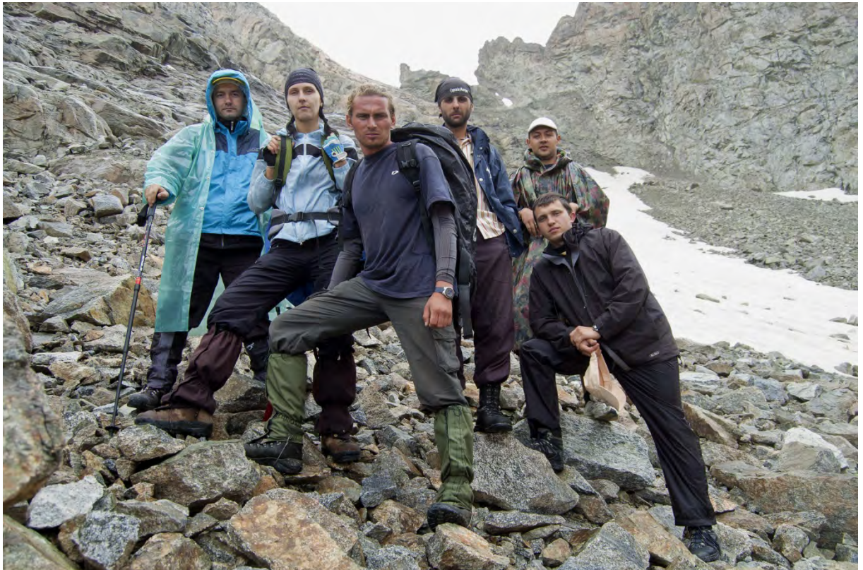
Фото 5 – Начало спуска с перевала Куршоу Нижний