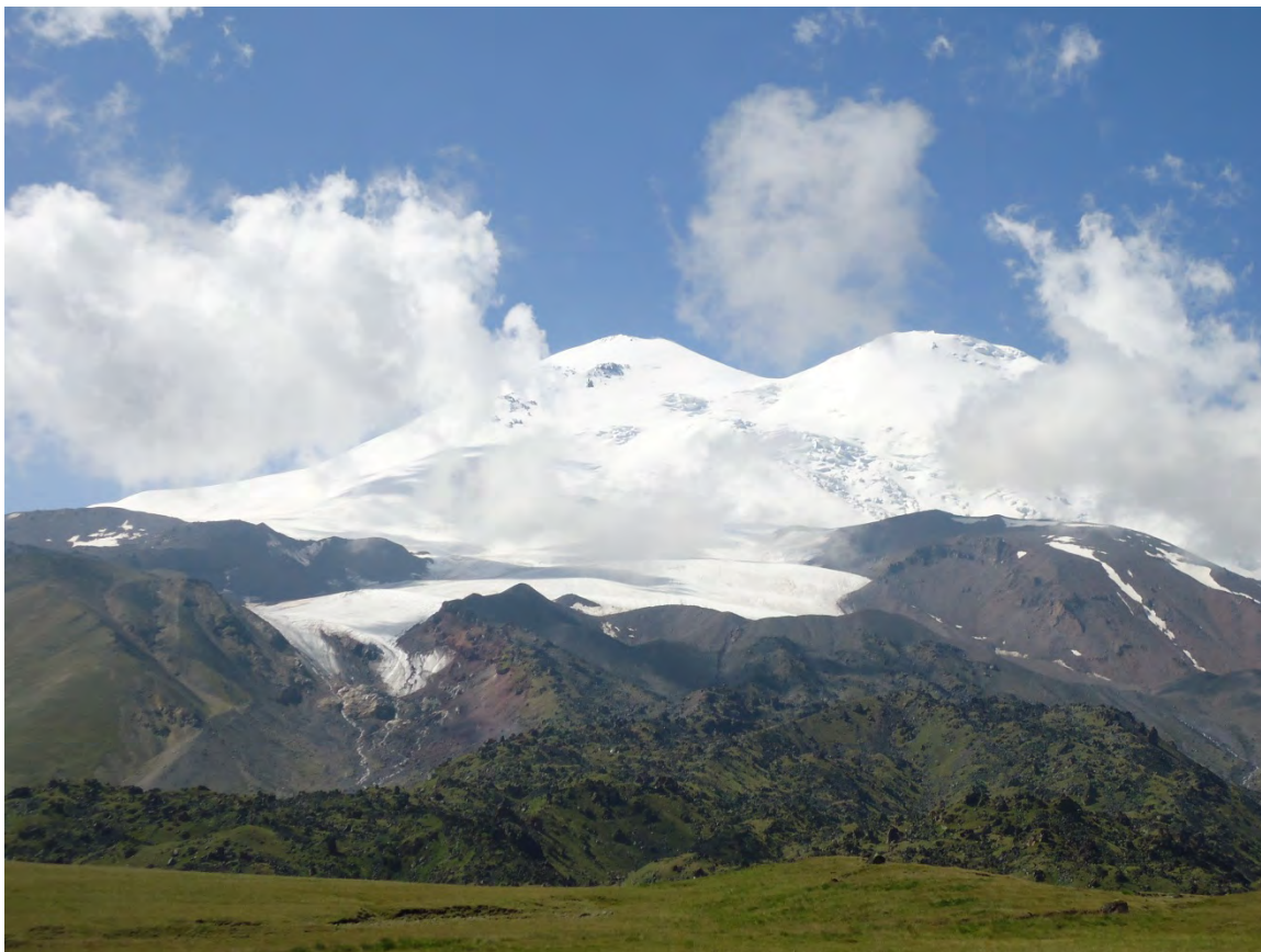
Фото 17 – Вид на Эльбрус с плато Ирахиксырт