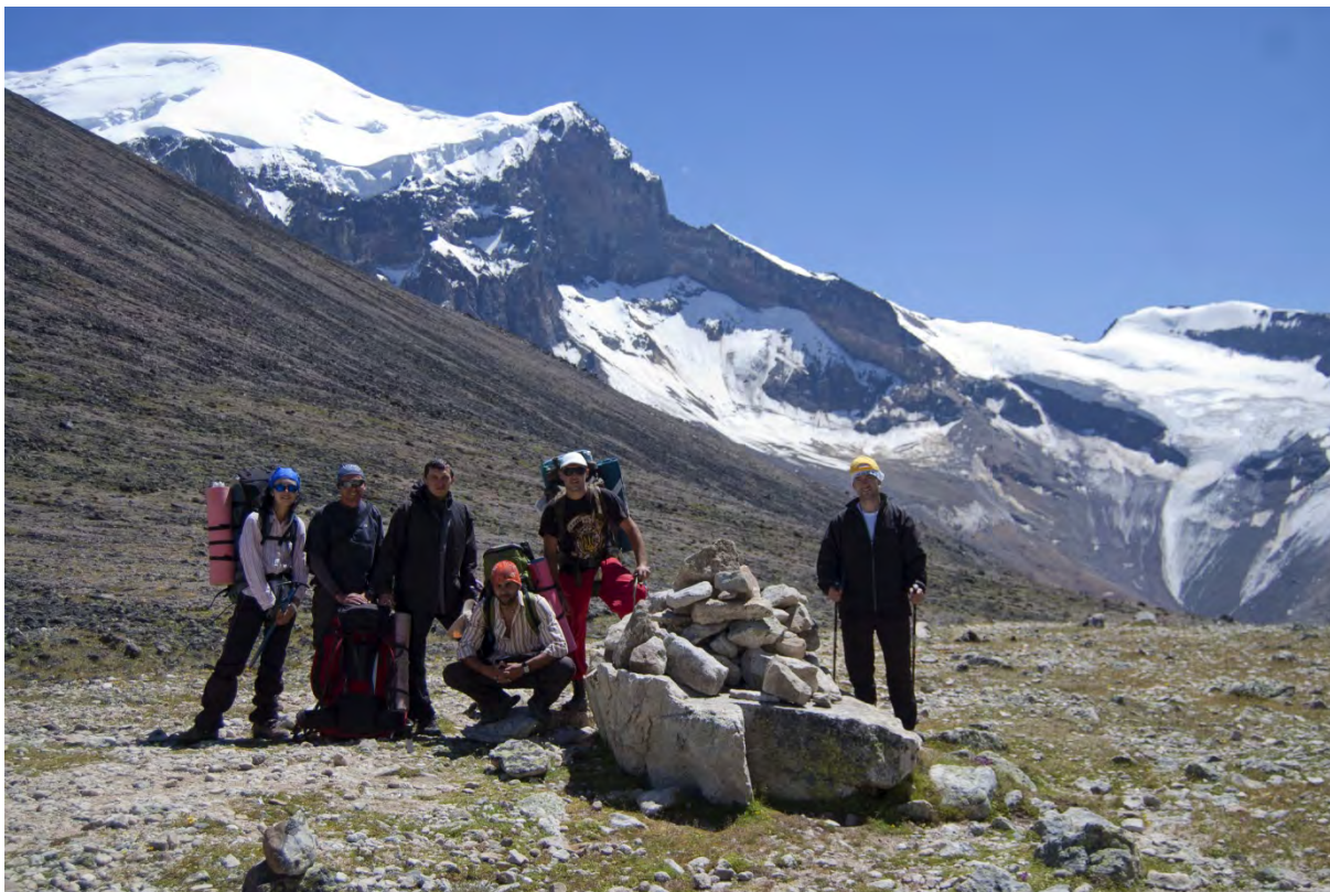
Фото 11 – На перевале Кольцевой