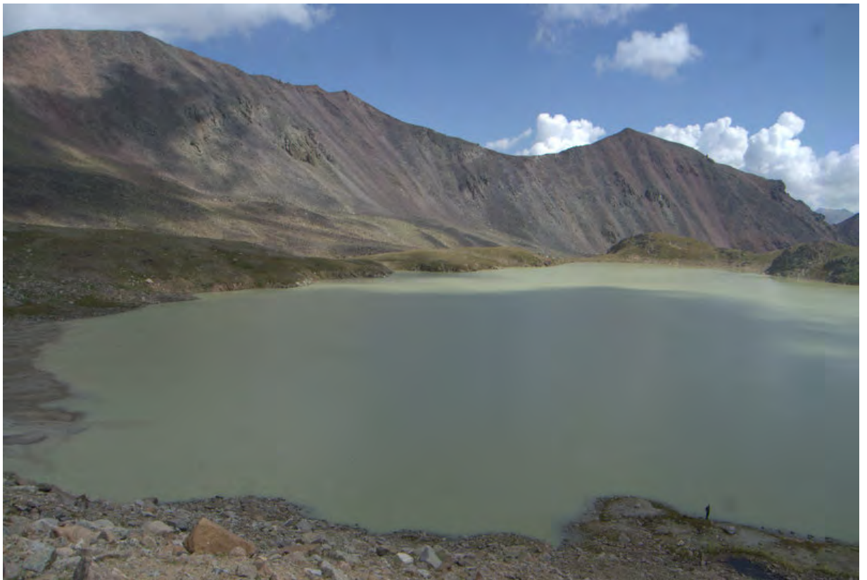
Фото 30 – Озеро Сылтранкель