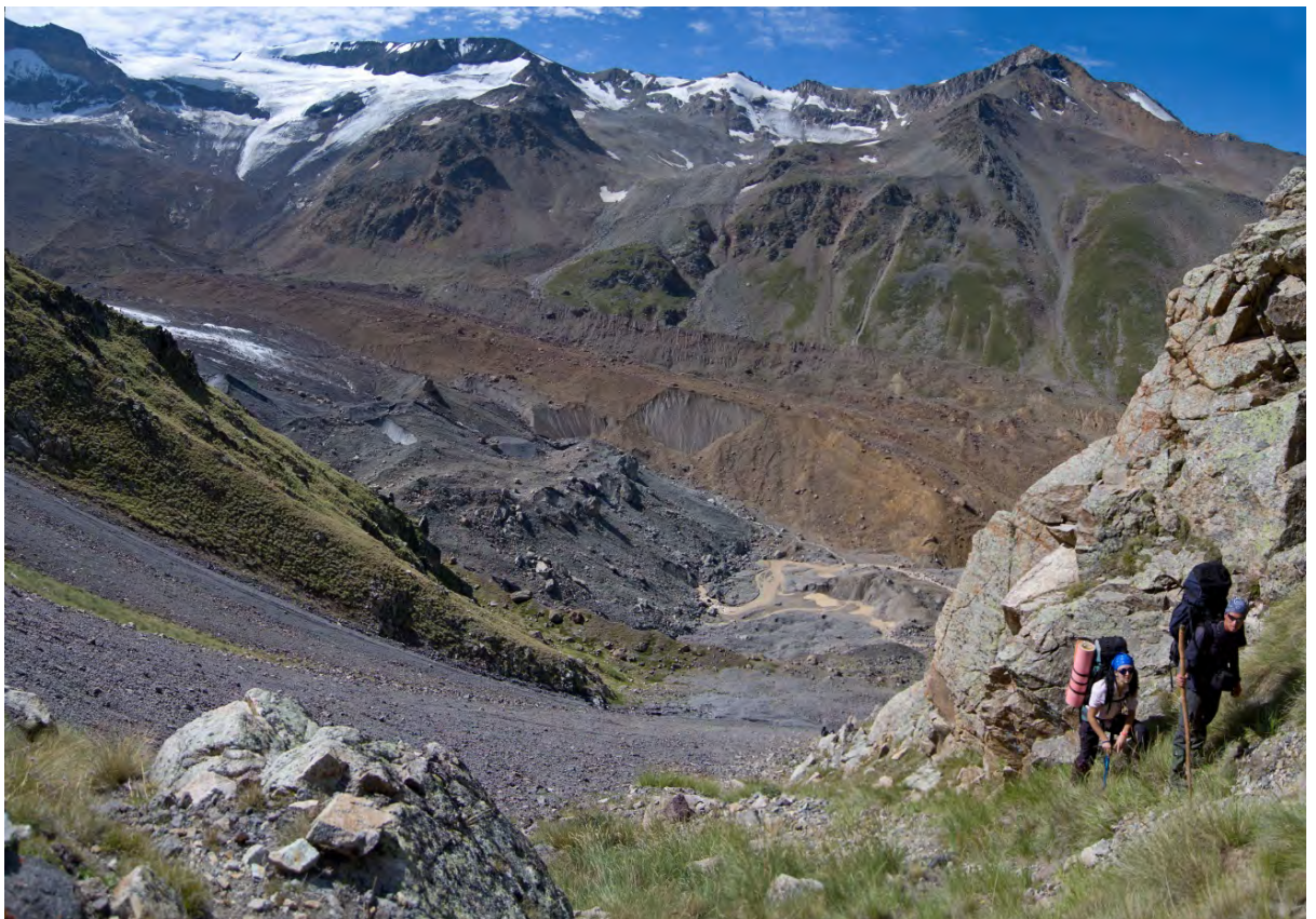
Фото 8 – Движемся на перевал Кольцевой