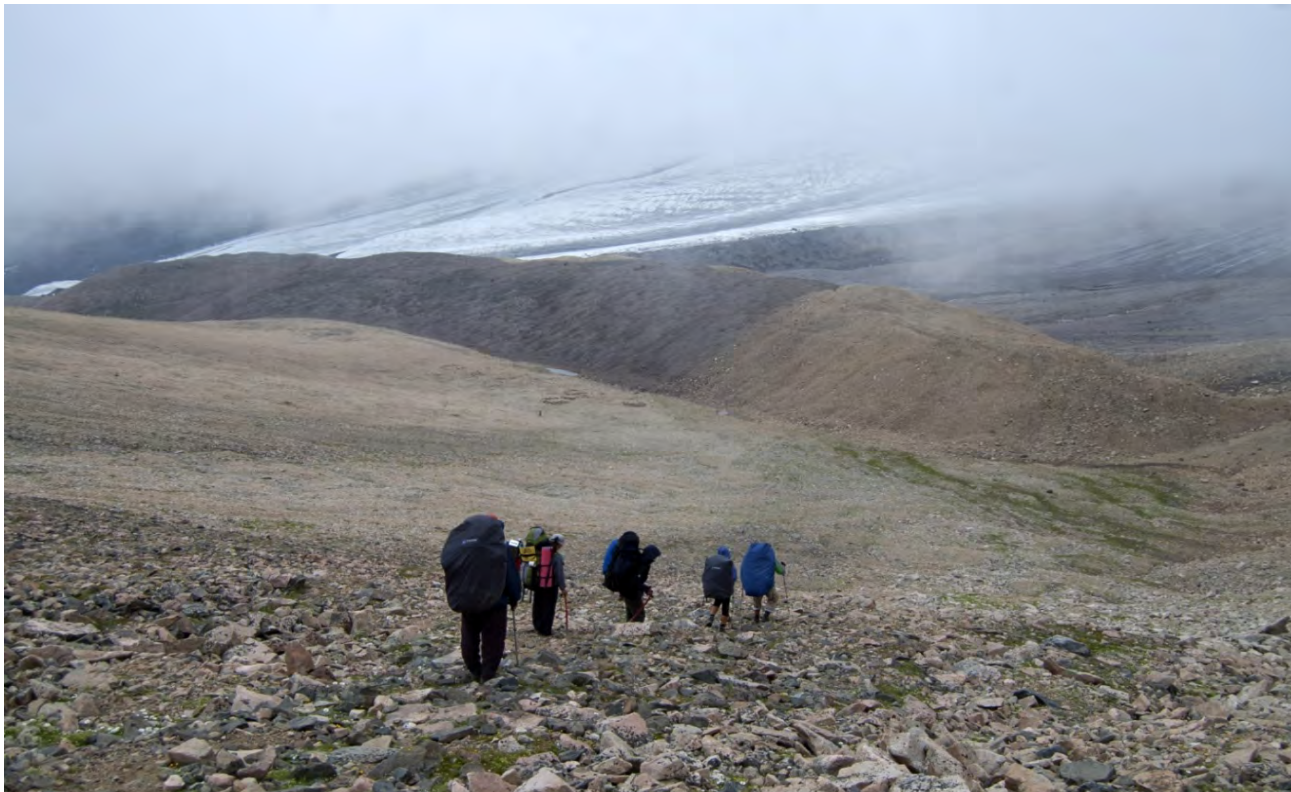
Фото 15 – Спуск с перевала Балк-баши