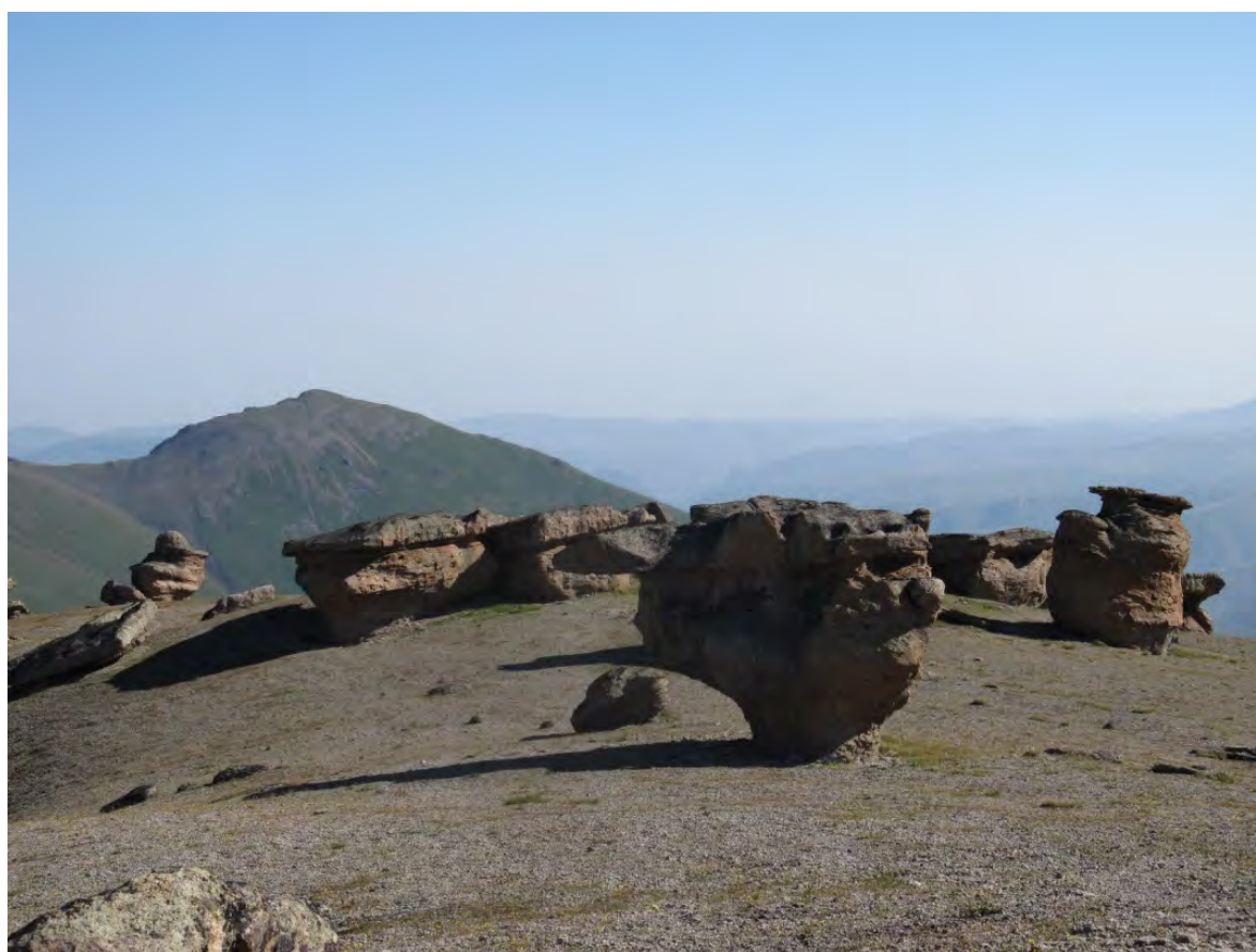
Фото 20 – Каменные грибы