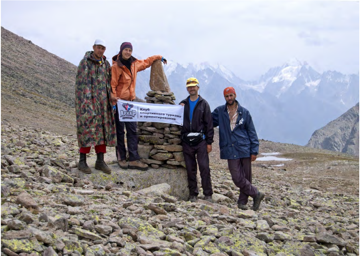
Фото 29 – Группа на перевале Сылтран