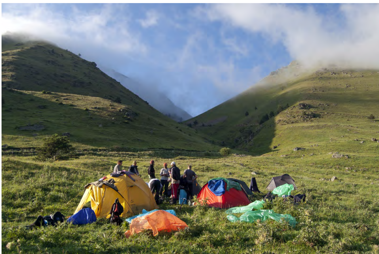
Фото 2 – Первая стоянка