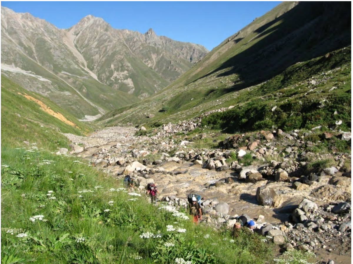
Фото 7 – Движемся вверх вдоль р. Уллхурзук в сторону перевала Кольцевой