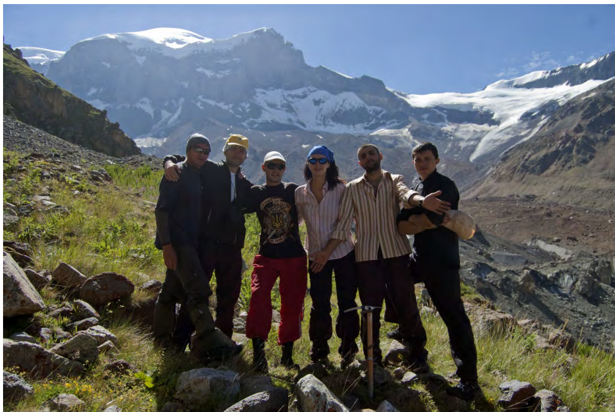
Фото 10 – Группа на фоне ледника Кюкюртлю, перед перевалом Кольцевой