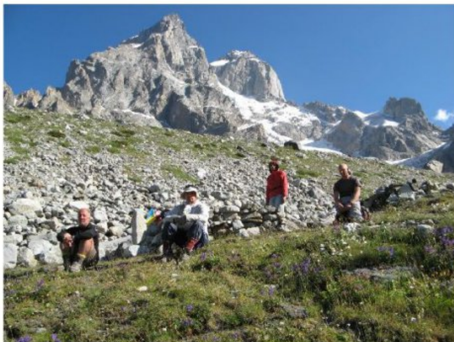
Рисунок 21 Вид со стоянок на в.Ушба , в. Гульба и пер.Гульба.