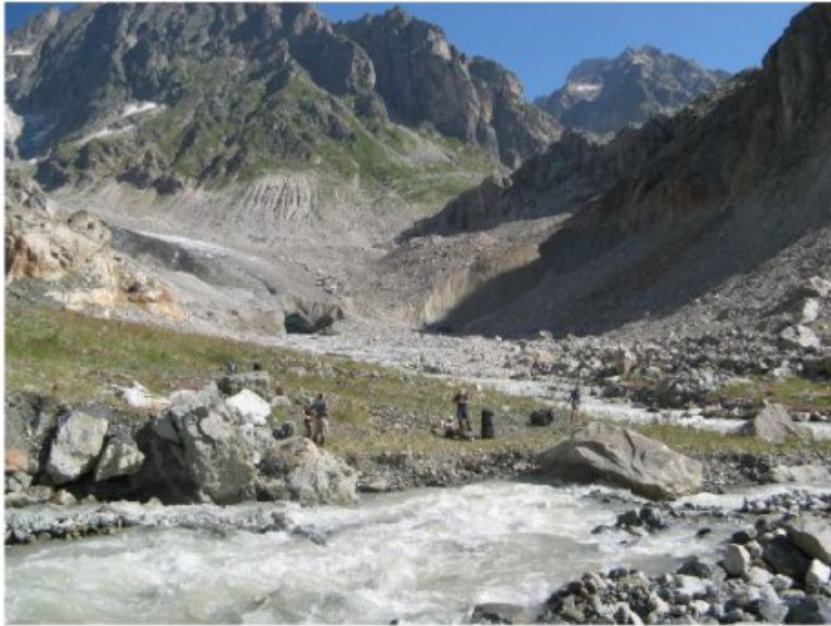
Рисунок 35 Ледовый мост образованный лед. Твибер через реку «Дзинал» возле переправы через приток.