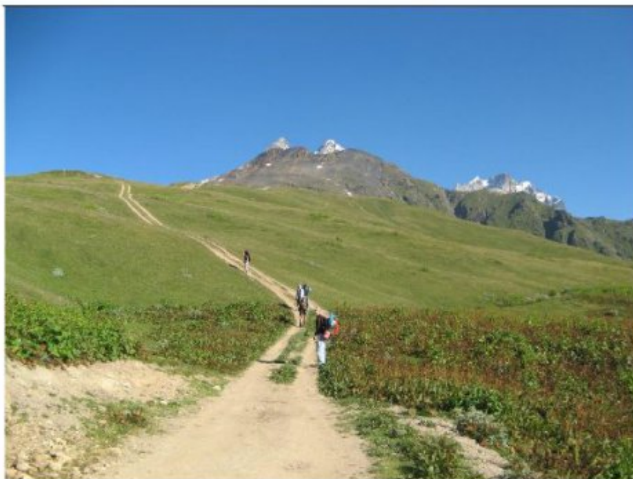
Рисунок 1 Вид на перевал Гульба 2 с Цханзара (Местийского кругозора)