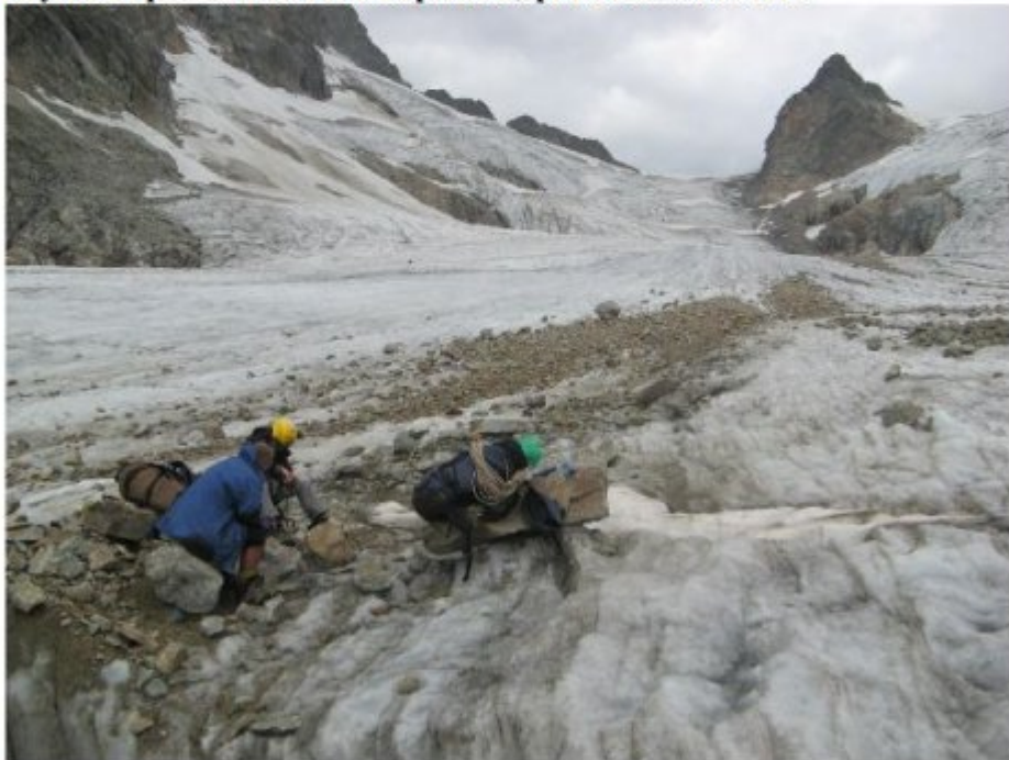
Рисунок 32 Спуск с перевала Башиль до нижнего ледопада.