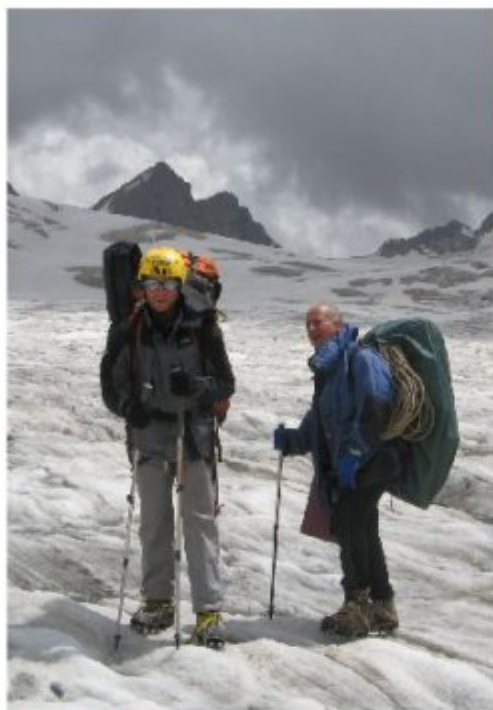
Рисунок 29 Перевальный взлет. Северная сторона пер. Башиль (с лед. Лекзыр)