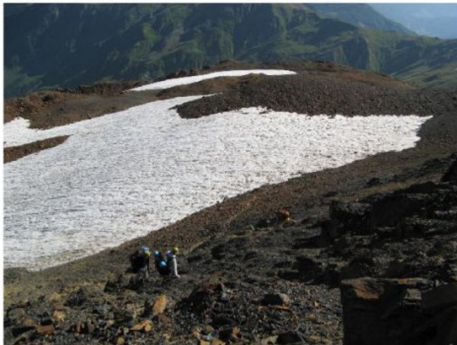
Рисунок 4 Вид с перевального взлета Гульба 2 на путь подъема.