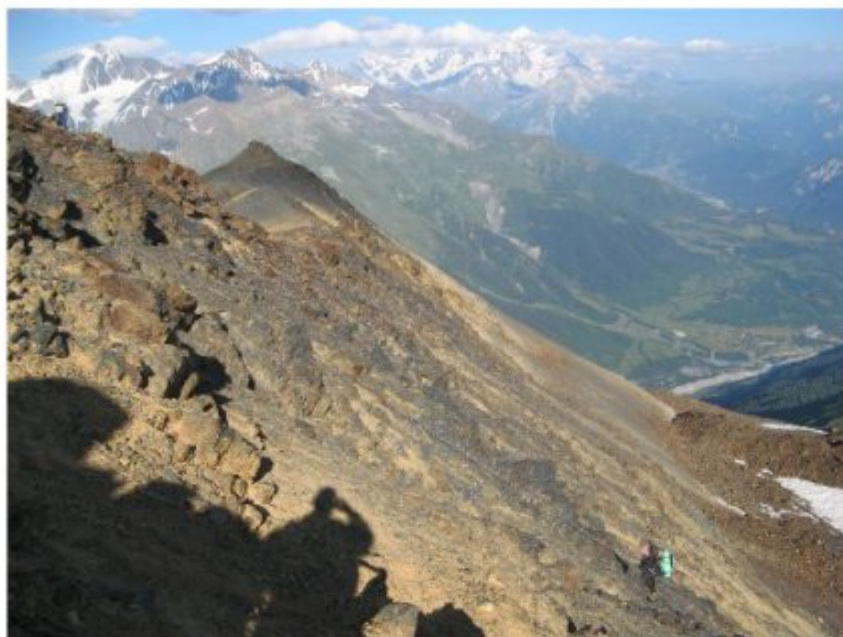
Рисунок 5 Перевальный взлет Гульба 2