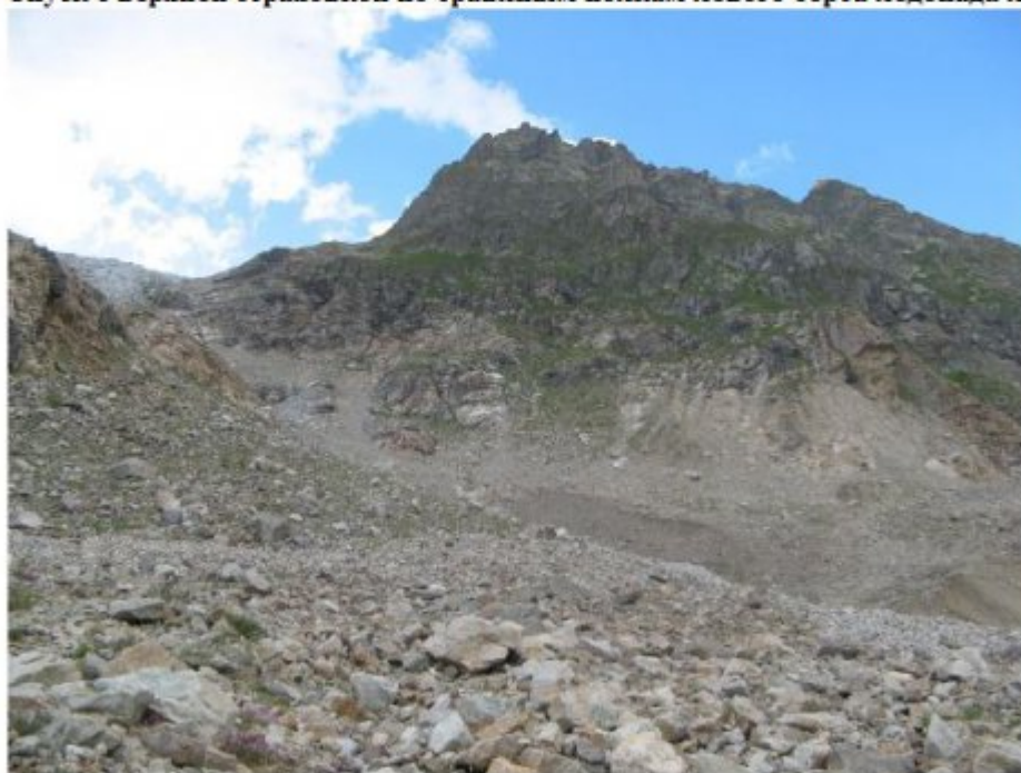
Рисунок 34 Спуск по травяным полкам от начала ледопада лед.Башиль к переправе из ледового моста и мелководья к реке «Дзигал»