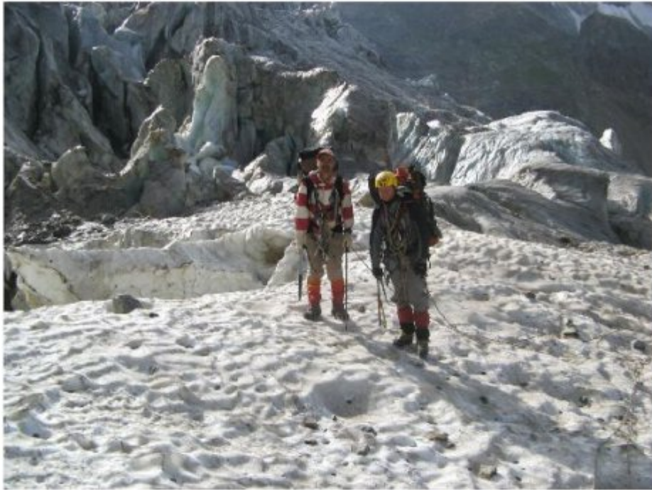
Рисунок 27 Траверс верхнего ледопада восточного языка лед. Лекзыр.