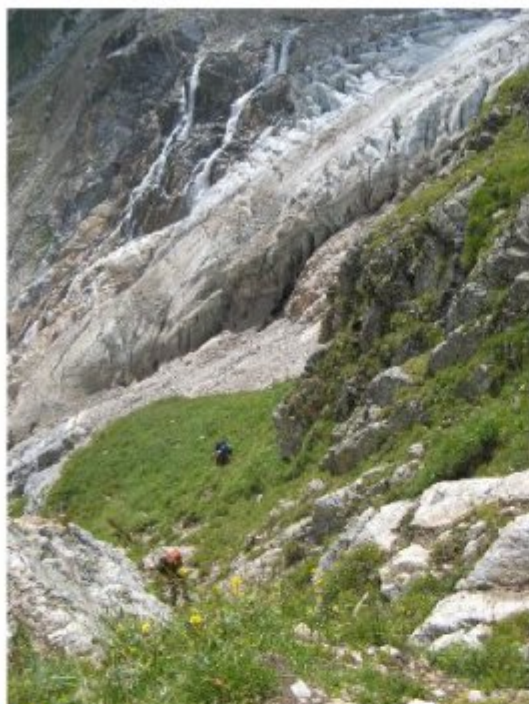
Рисунок 33 Спуск с верхней страховкой по травяным полкам левого борта ледопада лед. Башиль