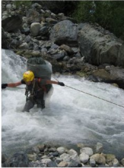
Рисунок 23 Переправа через ручей Мурквям по наклонным параллельным перилам. Страховка скользящим грудным карабином за верхние (по течению) перила.