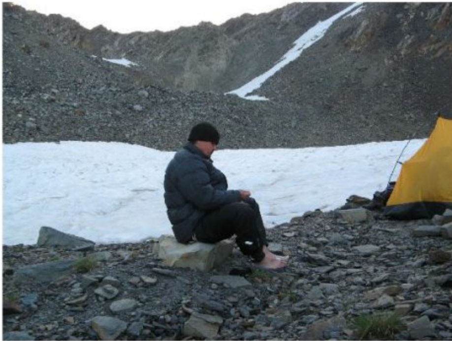
Рисунок 19 Вид с верхних стоянок лед. Гуль на перевал Гульба