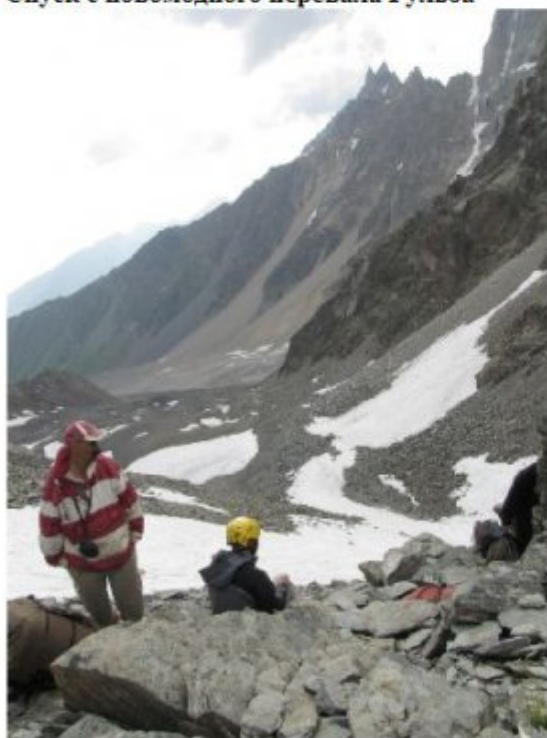
Рисунок 18 Вид спуска в ущелье к морене лед. Гуль с новомодного перевала Гульба