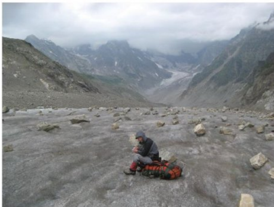
Рисунок 25 Лед. Лекзыр. Наш путь по восточной ветви «классика». Синий-предполагаемая новая тропа через хребет