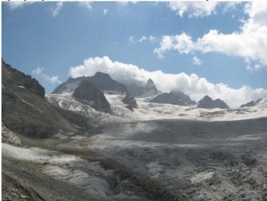
Рисунок 28 Вид пути подъема на перевал Башиль с Верхних Местийских ночевок