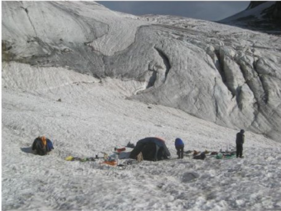
Рисунок 31 Спуск с перевала Башиль в верхний цирк на южном склоне