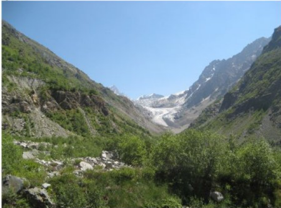
Рисунок 36 Ущелье р. Китлод