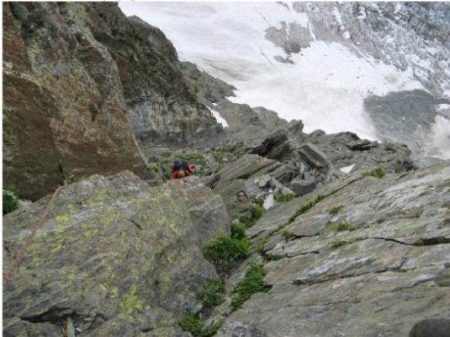
Рисунок 12 Подъем 200 метров по левому гребню камнеопасного кулуара на перевал Гульба.