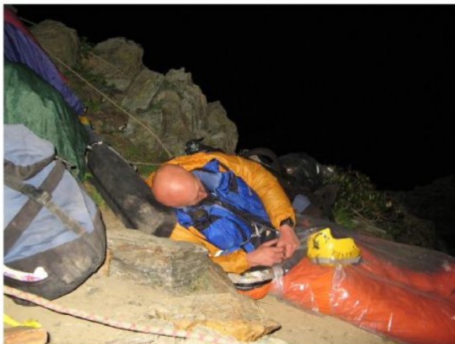
Рисунок 13 Ночевка на гребне. Участники и снаряжение на страховке.