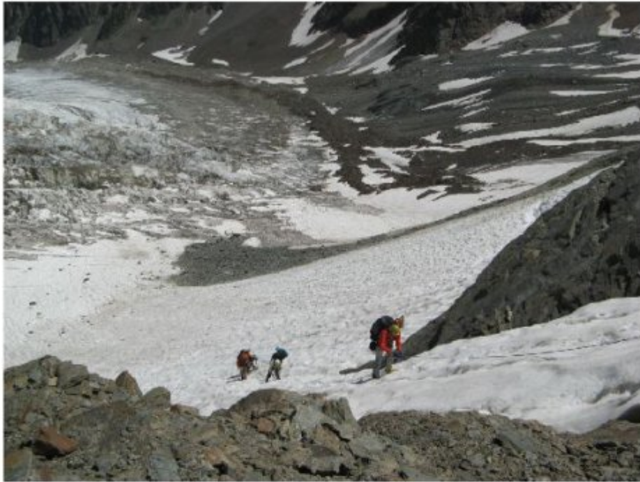
Рисунок 11 Начало подъема с ледника Чалаат на пер.Гульба по снежному языку справа по ходу от камнеопасного кулуара