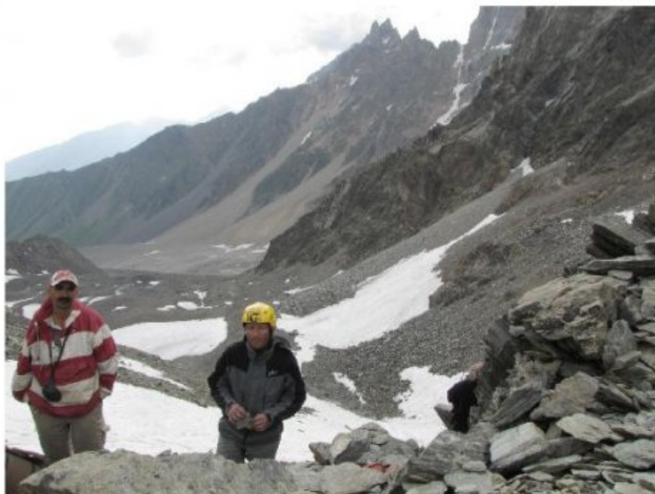
Рисунок 17 Спуск с новомодного перевала Гульба