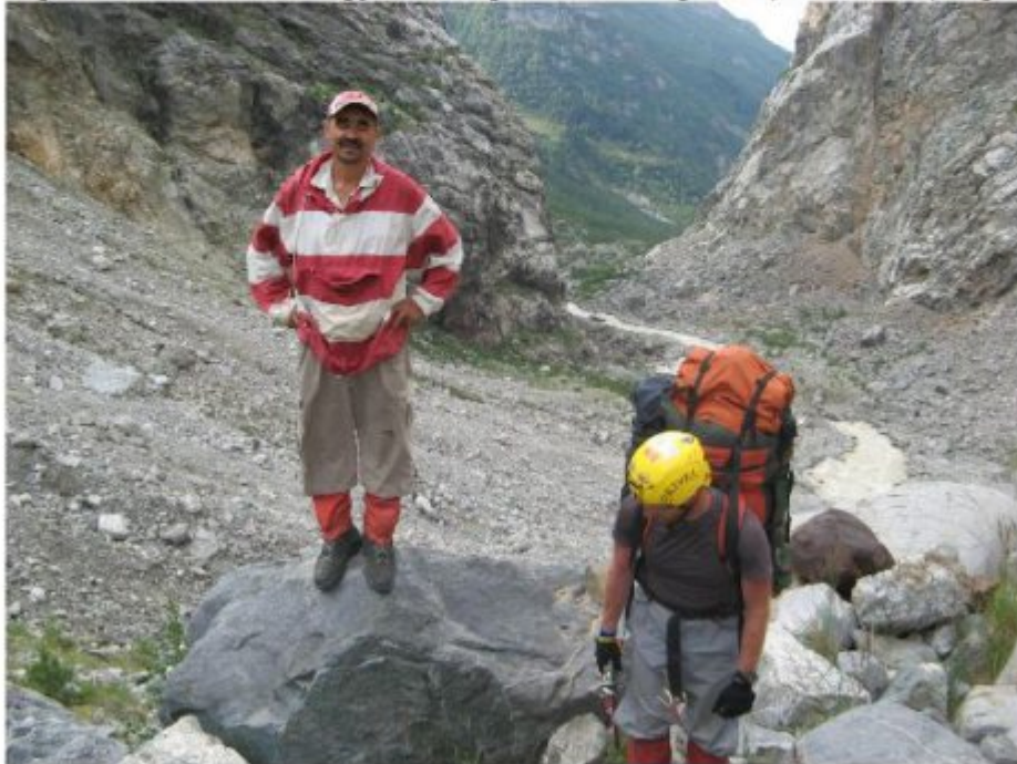
Рисунок 24 Верхние стоянки под устьем лед. Лекзыр