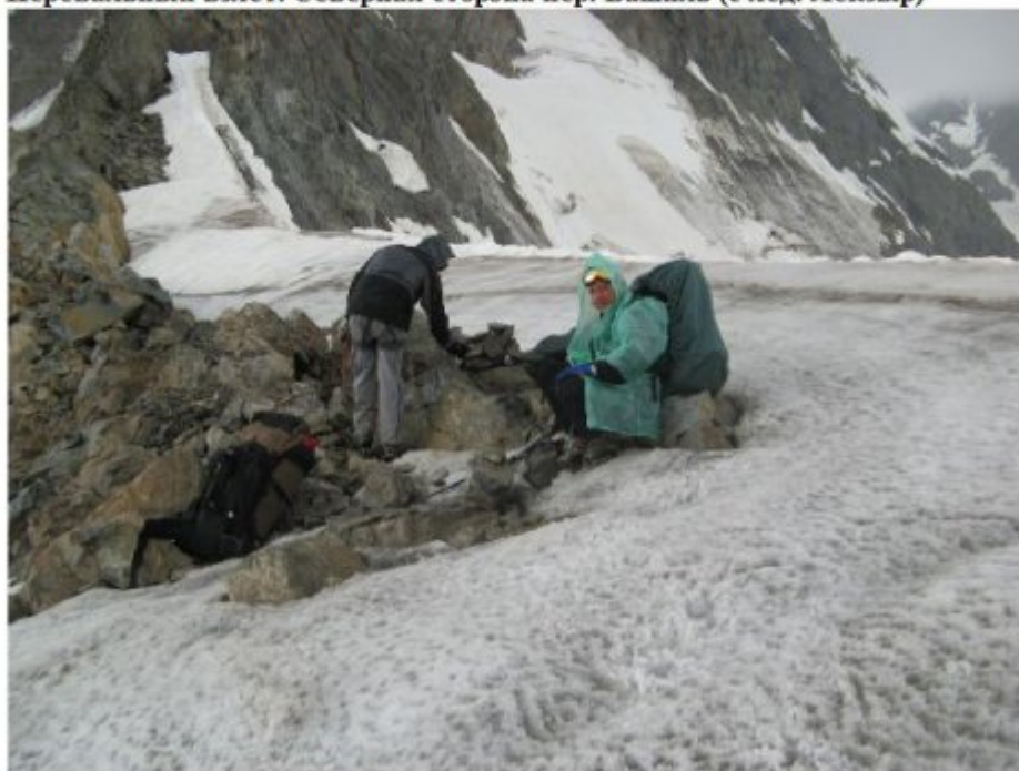
Рисунок 30 Складываем тур на пер. Башиль