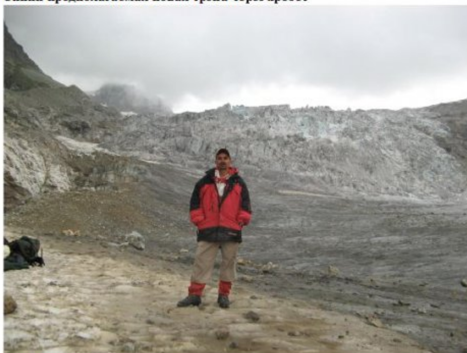
Рисунок 26 Путь по лед. Лекзыр к верхним Местийским почевкам.