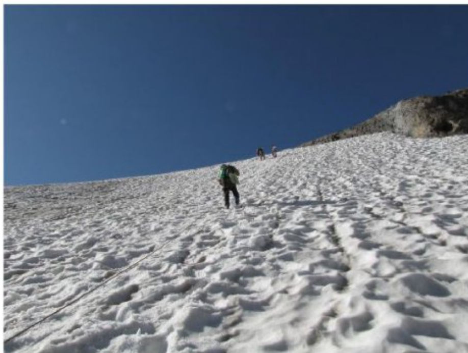
Рисунок 9 Спуск со стоянок на лед. Чалаат