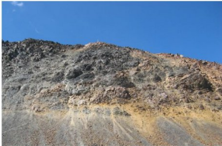
Рисунок 3 Перевальный взлет Гульба 2 со стороны пос.Местия