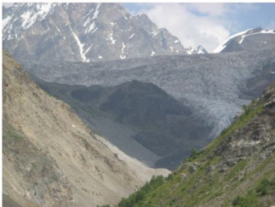
Рисунок 37 Осыпь перед верхними Китлодскими ночевками и путь на перевал Семи.