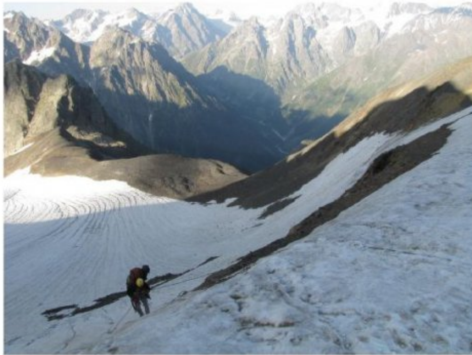
Рисунок 7 Спуск с пер. Гульба 2 на лед. Чалаат