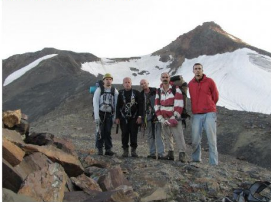
Рисунок 8 Вид со стоянок на спуск с пер. Гульба 2 на лед. Чалаат