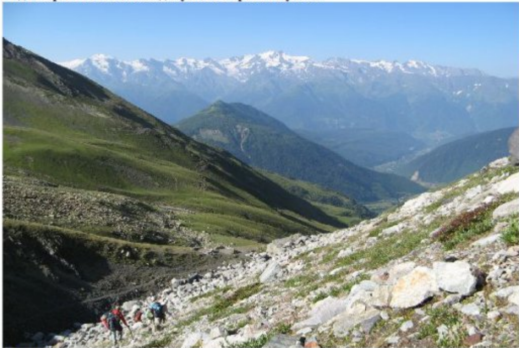
Рисунок 20 Спуск с морены лед. Гуль в долину реки Гуличала