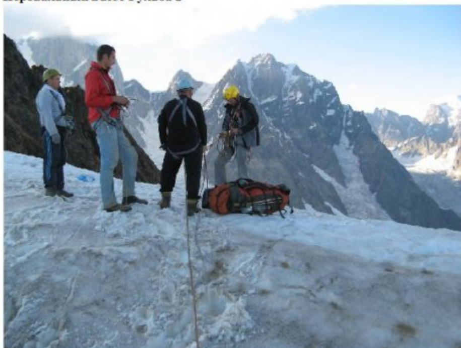
Рисунок 6 Перевал Гульба 2. Организация спуска на ледник Чалаат.